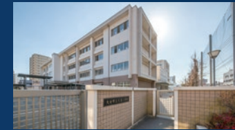
大分市立大道小学校 徒歩約10分(約758m)

田室町を選ぶ理由の一つが、徒歩10分圏内に、保育園、幼稚園、大道小学校、王子中学校が揃う恵まれた教育環境です。大分大学教育学部附属の小・中学校へも徒歩7分という、向学心を育む。身近な美術館や図書館、緑豊かな公園も健やかな育ちをサポートします。