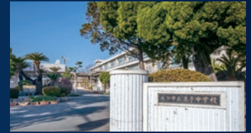
大分市立王子中学校 徒歩約6分(約418m)