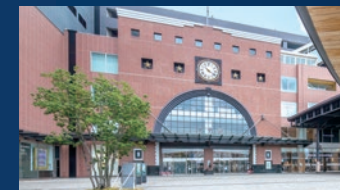
JR「大分」駅 徒歩約13分(約1,010m)