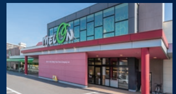
サンライフメロン 徒歩約5分(約350m)

※上記掲載距離は、住宅地図をもとに現地からの最短距離を計測したものです。※徒歩所要時間表示は分速80m、車による所要時間は時速40kmで算出しております。※地図は概略図につき省略されている道路・施設がございます。